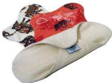
Compresas de tela Primal

Las compresas y salvaeslips de tela se pueden lavar en lavadora con el resto de la ropa. Si después de quitarlas lavamos a mano lo más gordo y las dejamos en remojo en agua fría, las manchas salen mejor. La opción más económica es hacérselas una misma, en la web citada líneas atrás encontrarás enlaces a páginas que explican cómo hacerlo 1 . Comprado, un juego de doce compresas “made in la península ibérica” nos puede salir entre los 22€ que costarían las confeccionadas por Vera Martins en Oporto 2 (de algodón estampado, generalmente aprovechado de retales) y los 60-100€ (varía según tamaños) que nos costarían las Primal 3 , confeccionadas en Almería (de las que podríamos optar por el más recomendable modelo “crudo”, sin blanqueantes ni tintes). El mayor precio de la marca almeriense se justifica en parte por la mayor calidad de sus componentes (algodón de cultivo ecológico, bambú y celulosa).